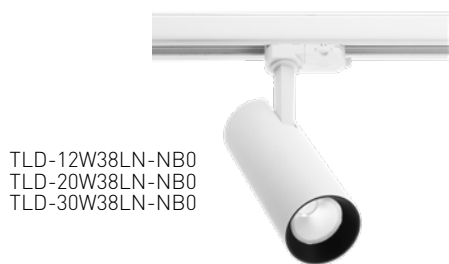
TLD-12W38LN-NB0 TLD-20W38LN-NB0 TLD-30W38LN-NB0