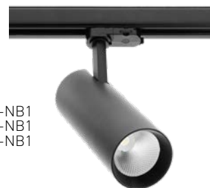
TLD-12W38LN-NB1 TLD-20W38LN-NB1 TLD-30W38LN-NB1