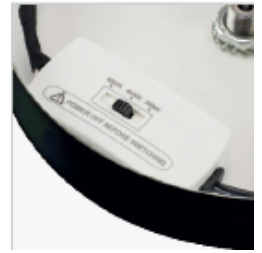
Farbwahlschalter im Baldachin