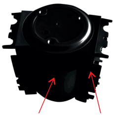
89-1055 + 89-1056 Flexibler Verbindungsblock + Verbindungsstücke

Optionales Zubehör zur Erstellung von Leuchtensystemen: