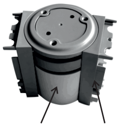
89-1022 + 89-1023 Flexibler Verbindungsblock + Verbindungsstücke