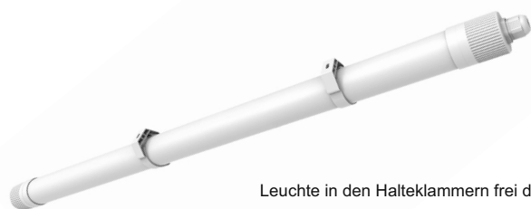
Leuchte in den Halteklammern frei drehbar