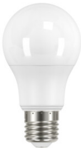
IQ-LED A60 7,2W