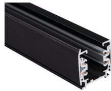
33232 TEAR N TR 2M-W

Zubehör für Schienensystem, TEAR N TR 2M-W, 3-Phasen- Stromschiene, weiß, (33232)