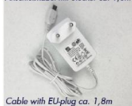
Cable with EU-plug ca. 1,8m